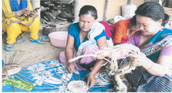
মচু পাস্তোক্কাহনবা লং