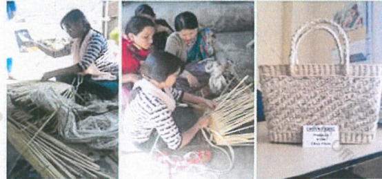
ভেলন্দ্রিগী লংদগী মখল-মখা কয়গী পোথোক্কাশিং শেস্বা